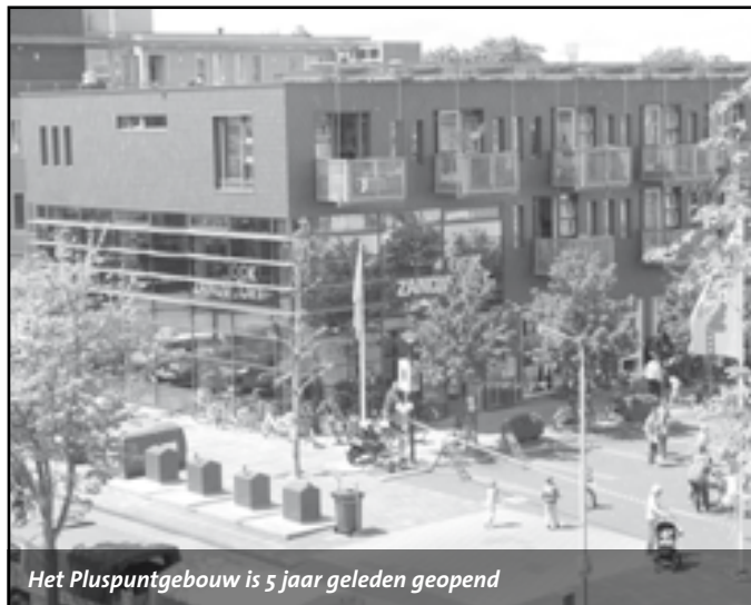
Het Pluspuntgebouw is 5 jaar geleden geopend

Het gebouw Pluspunt aan de Flemingstraat bestaat in september vijf jaar en dit eerste lustrum zal uitbundig worden gevierd met een feestweek van 17 tot en met 22 september. Er staan tal van activiteiten op het programma waaraan iedereen gratis kan deelnemen.